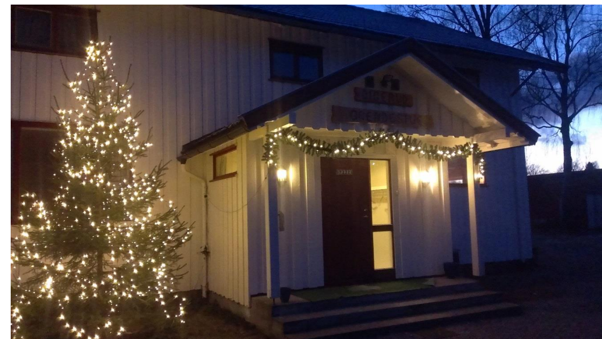
Digerud grendestue pyntet til jul